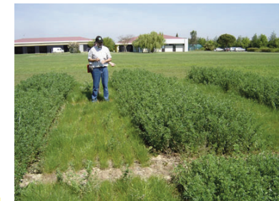
El centro de investigación (Sur de Francia)