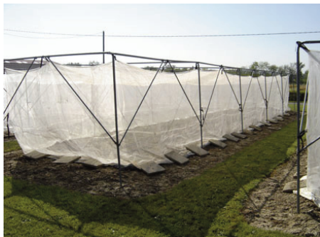
Selección de las plantas más resistentes a los nematodos