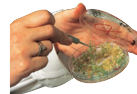
El control de la pureza